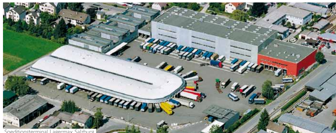
Speditionsterminal Lagermax Salzburg